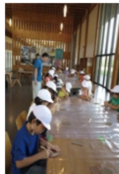
体験の様子 / 小ホール