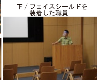
下 / フェイスシールドを装着した職員