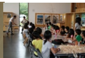
体験の様子 / 小ホール