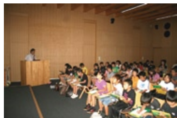
■左 / 世界遺産学習の様子 映像ホール（平成30年撮影） 通常収容100名