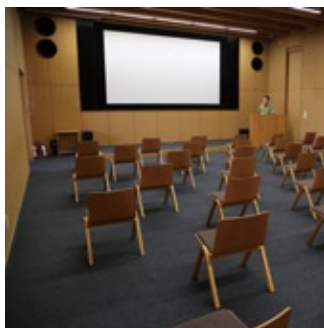
■新型コロナウイルス感染症対策 席間約1.5m（映像ホール） 収容人員100名のところ、40名（席）で学習をします。職員は飛沫感染を防ぐため、フェイスシールドの装着または前面にアクリルパネルを設置してお話します。