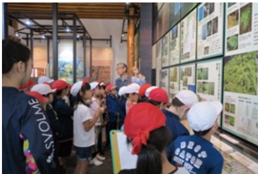
■展示案内の様子（小学生）平成30年撮影 / 常設展示室