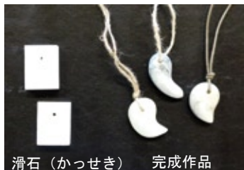
滑石（かっせき） 完成作品