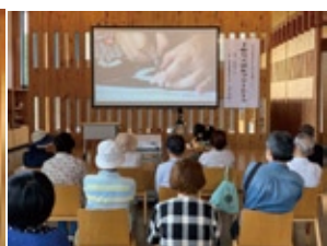
収容人員約200名のところ、80名（席）で学習をします。