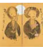
神莫山《寒山拾得》1994年 県立美術館蔵

☎059・227・2100 FAX059・223・0570 県立美術館 三重県立美術館 Q検索