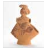
人物埴輪(巫女) 石薬師東古墳群

☎059・228・2283 FAX059・229・8310 県総合博物館(MieMu) みえむ 古墳時代 Q検索