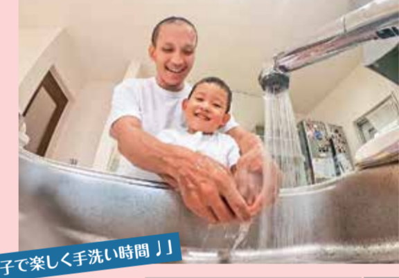
「親子で楽しく手洗い時間！」