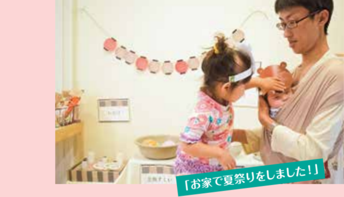
「お家で宴祭りをしました！」