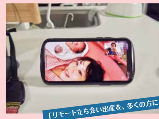
「リモート立ち会い出産を、多くの方に」

「ファザー・オブ・ザ・イヤー in みえ」では、広く県民の皆さんに「男性の育児参画」について関心を持っていただくことを目的に、積極的に育児に参加する男性の様子を募集・表彰しています。今回は、「新しい生活様式」での子育ての工夫や子どもとの過ごし方などをテーマにパパの育児フォトコンテストを開催し、1,350作品の応募の中から、4作品のベストショット賞を選定しました。