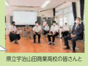
県立宇治山田商業高校の皆さんと

いろいろな家族のカタチがあるので、コミュニケーションを大切にパートナーと協力して子育てをすることが大切だと思います。