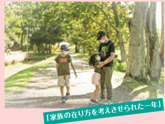
「家族の在り方を考えさせられた一年」

「ファザー・オブ・ザ・イヤー in みえ」では、広く県民の皆さんに「男性の育児参画」について関心を持っていただくことを目的に、積極的に育児に参加する男性の様子を募集・表彰しています。今回は、「新しい生活様式」での子育ての工夫や子どもとの過ごし方などをテーマにパパの育児フォトコンテストを開催し、1,350作品の応募の中から、4作品のベストショット賞を選定しました。