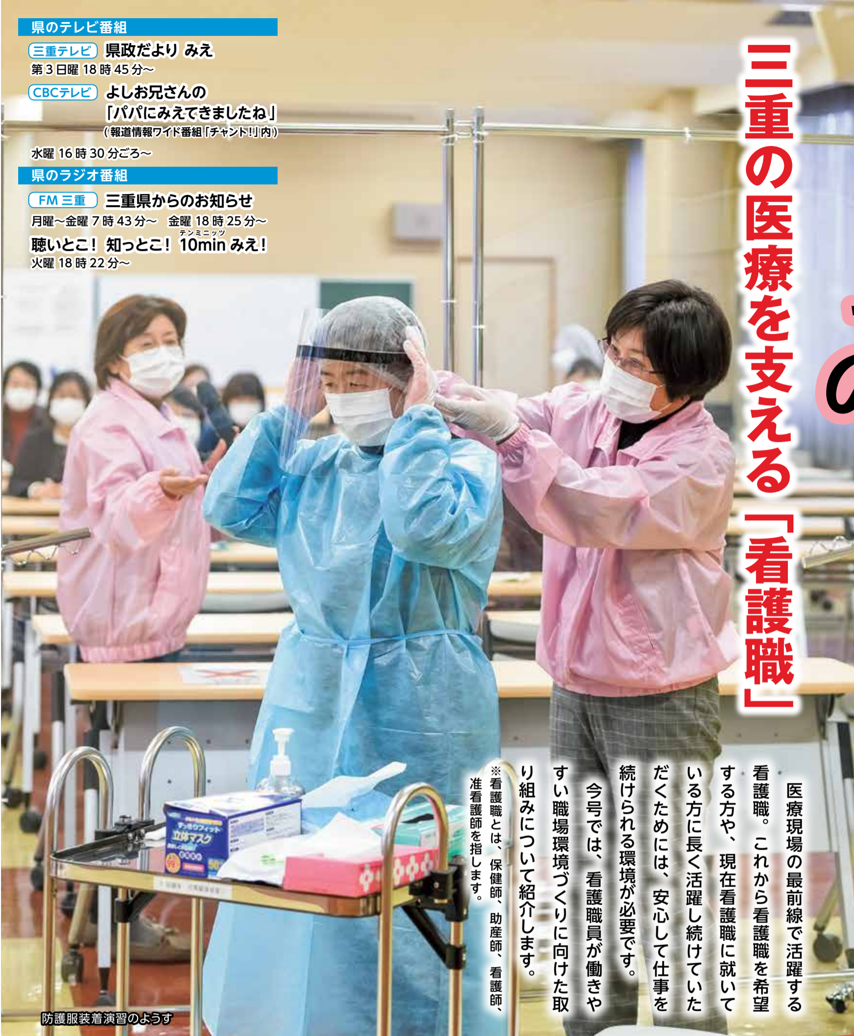
防護服装着演習のようす

医療現場の最前線で活躍する看護職。これから看護職を希望する方や、現在看護職に就いている方に長く活躍し続けていただくためには、安心して仕事を続けられる環境が必要です。今号では、看護職員が働きやすい職場環境づくりに向けた取り組みについて紹介します。*