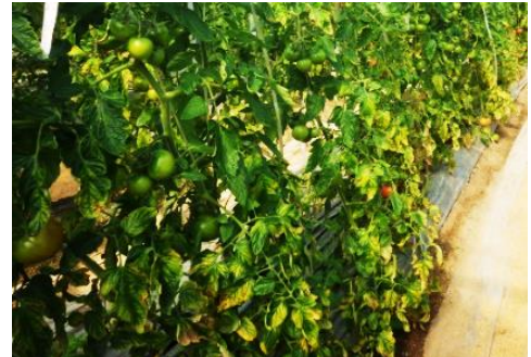
図1 トマト黄化病の多発生ほ場