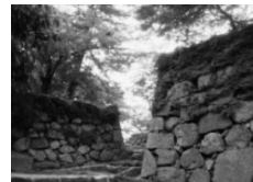
松坂城跡 (国指定史跡)

松坂城は戦国武将・蒲生氏郷によって1588(天正16)年に築かれた平山城。かつては本丸と二ノ丸に石垣を築き、3層の天守に敵見、金の間、月見などの櫓が配された堅城だった。現在は、そびえ立つ石垣を残り公園として整備され、桜や藤、イチヨウの名所として広く市民に親しまれている。