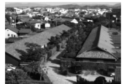
御城番屋敷 (国指定重要文化財)

松坂城は戦国武将・蒲生氏郷によって1588(天正16)年に築かれた平山城。かつては本丸と二ノ丸に石垣を築き、3層の天守に敵見、金の間、月見などの櫓が配された堅城だった。現在は、そびえ立つ石垣を残り公園として整備され、桜や藤、イチヨウの名所として広く市民に親しまれている。