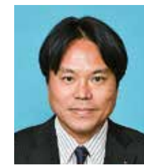
副議長 稲垣 昭義