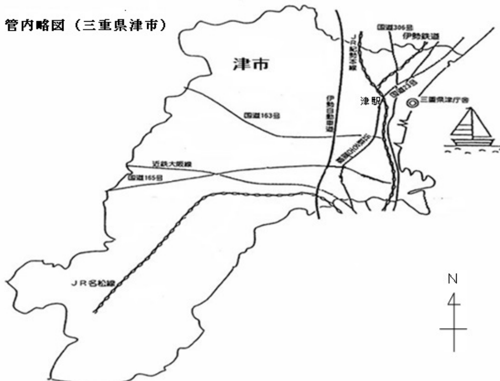
管内略図(三重県津市)

また、380年以上前の寛永年間に始まった「八幡神社祭礼」が起源の津まつりでは、「唐人踊り」「しゃご馬」等の伝統行事が披露されています。