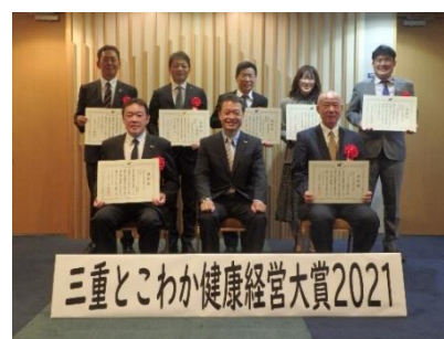
大賞受賞企業の皆さま