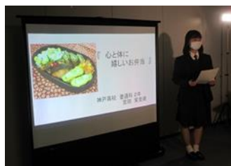
PR動画 入賞者プレゼンの様子