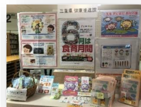
県立図書館とのコラボ啓発

バランスのとれた食事をはじめ、野菜摂取や減塩を推進するため、多様な主体と連携した啓発を行いました。