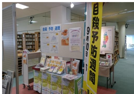
自殺予防週間の啓発