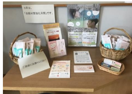
自殺対策強化月間の啓発