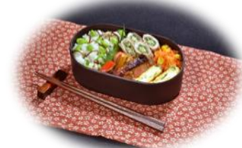
Web投票により決定した最優秀賞作品 「心と体に嬉しいお弁当」