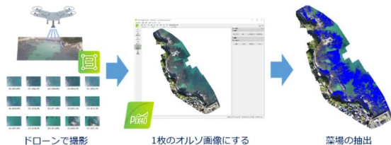
図1. オルソ画像の生成と藻場領域の抽出

藻場領域の抽出の手順を図1に示す。画像解析ソフト(Pix4Dmapper)により、ドローンで撮影した画像群からオルソ画像を生成した。次に、色情報(HSV)を利用した画像処理で、藻場領域を抽出し、それらをウェブサイトに表示できるように適切な画像容量・形式に変換した。