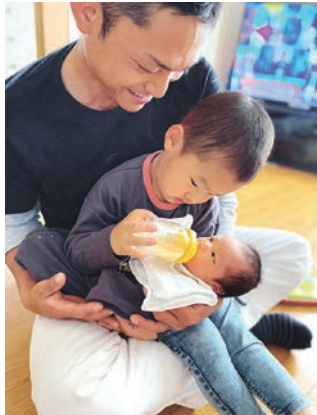
第8回ファザー・オブ・ザ・イヤー in みえ 「パパの育児フォトコンテスト」ベストショット賞受賞写真

地域や職場全体で男性の育児参画への理解を深め、男性の育児参画が当たり前で、父親・母親が協力して育児に取り組む、子育てしやすい三重にしていくための、男性の育児参画を進める提案・アイデア。