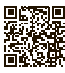
三重県ホームページ