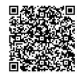
三重県電子申請システム