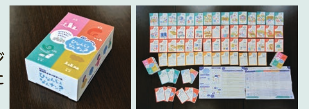
避難所イメージゲーム「ひなんじょ なんなん?」

②主に小学校高学年を対象とした、避難所イメージゲーム「ひなんじょ なんなん?」や、災害発生時にとるべき行動などを学べる防災DVD教材を作成。