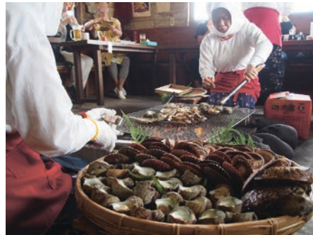
海女小屋体験の様子

持続可能な観光地づくりに向けて、三重を何度も訪れるリピーターの創出、地域の特色を生かした観光コンテンツの整備・磨き上げ、滞在日数の延長につながる情報発信、「食」の魅力を生かした総合的な取り組み、観光防災の取り組みなど、地域の総合力を発揮した三重ならではの観光振興の提案・アイデア。