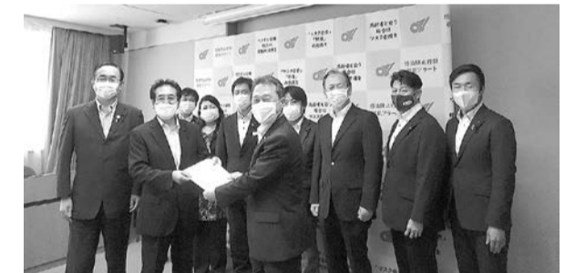
知事への申し入れの様子(7/25)