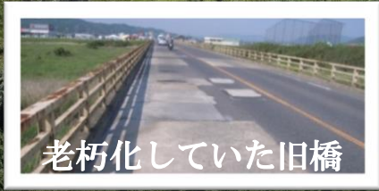
老朽化していた旧橋