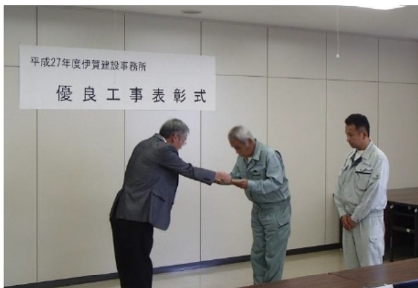
【株式会社西山建設 様】