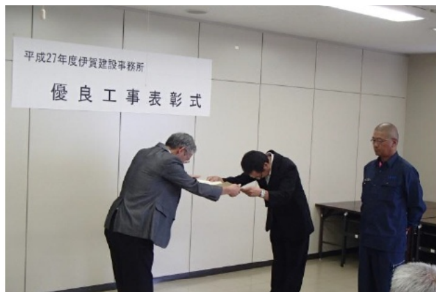
【株式会社廣嶋組 様】