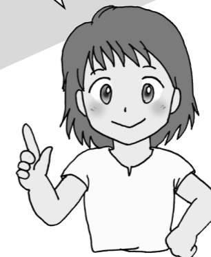
食の安全・安心キャラクター こころ

三重県では平成15年1月に策定した「食の安全・安心確保基本方針」に基づき、食の安全・安心の確保に取り組んできました。しかし、昨年は県内で食品の不適正表示事案が続発しました。そこで、「食の安全・安心危機対策本部」を設置し、平成20年度は、食品表示の一元的な監視体制の整備など食の安全を確保できる監視・指導体制の充実強化や、「みえの食品安全・安心表示ガイドライン」の普及啓発など再発防止等に取り組むこととしています。