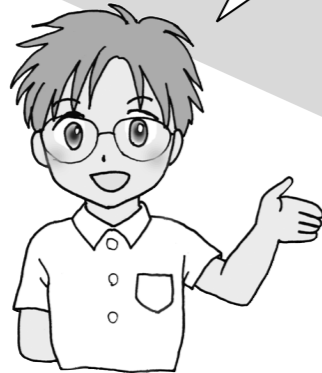
食の安全・安心キャラクター まもる