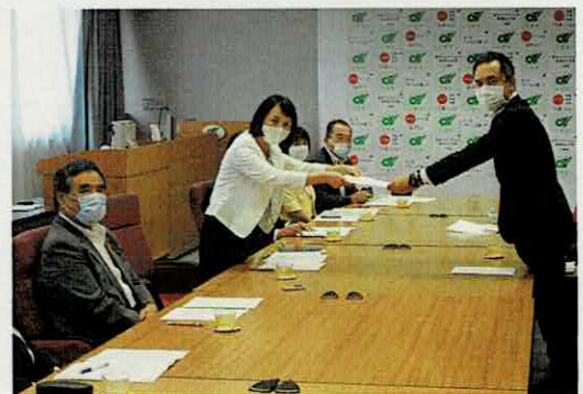
知事への申し入れ

今後の補正予算及び来年度当初予算の編成に当たっては、新しい生活様式や価値観、さらには「みえモデル」で示された視点を踏まえて事業精査を行うとともに、議会における予算審議の際には事業精査の判断理由についても示すこと。