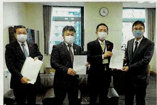
内閣官房国土強靱化推進室次長に 意見書を手渡す3議長