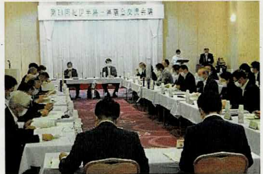
紀伊半島三県議会交流会議