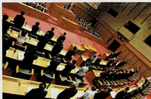
決議案を全会一致で可決

この決議では、北朝鮮に対し、一日も早く拉致被害者全員を帰国させるよう強く求めるとともに、国会および政府において、日本人拉致問題の早急な完全解決のために全力を尽くして取り組むことを要望しています。