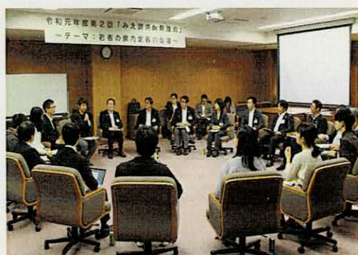
みえ現場 de 県議会

2月14日に三重大学で、「若者の県内定着の促進」をテーマに開催しました。当日は、若者の県内定着の促進に取り組む関係者の方や若者の県内定着に関心のある方々が、高等学校卒業後や高等教育機関卒業後の県内定着に向けた取り組み等について意見交換を行いました。