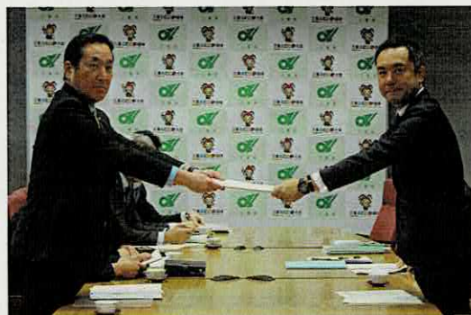
知事への申し入れ