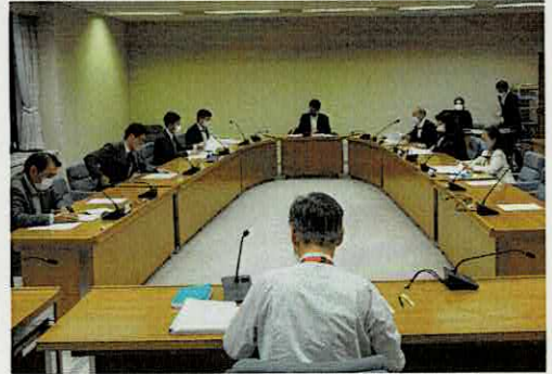
プロジェクト会議

プロジェクト会議では、これまでの新型コロナウイルス対策にかかる議会の取り組みの検証、これらを踏まえた今後の議員の行動指針の検討等を行うほか、議員参集のリスクが生じた場合の、委員会のオンライン開催にかかる条例改正についても検討を行いました。