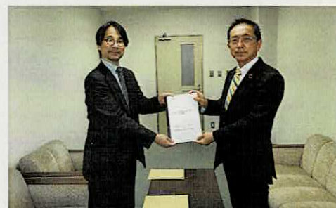
座長から報告書を受け取る議長