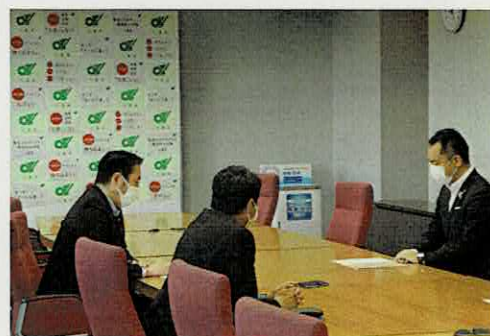
知事への申し入れ