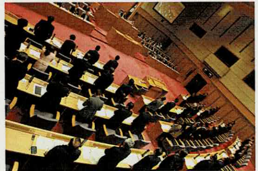
意見書を全会一致で可決

この意見書では、今後、CSFの予防的ワクチン接種がよりの確に実施され、養豚農家の負担軽減が行われるよう、抗体付与率を上げるための手法の検討など必要な取組をすることを国に求めました。