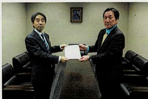
参議院請願課長に意見書を手渡す議長