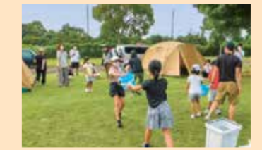
防災キャンプ (鈴鹿市)

令和4年度には、子どもたちに防災について楽しく学んでもらう「防災キャンプ」を開催したり、実際に被災地を訪れてボランティア活動を行ったりしました。また、その様子をSNSで、若者に向けて情報発信しています。