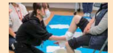
足浴ボランティア (宮城県東松島市)