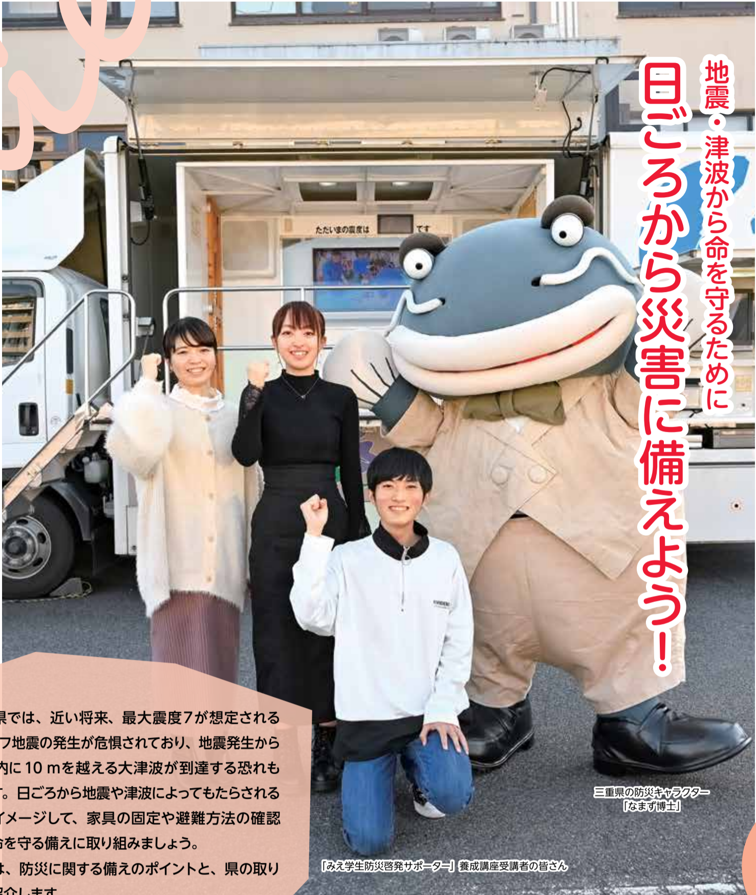
三重県の防災キャラクター「なまげ博士」