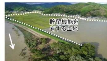
貯留機能を有する土地のイメージ