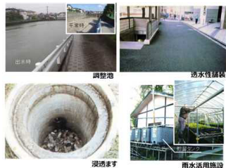
雨水貯留浸透施設の例