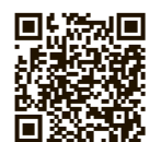
議長定例記者会見