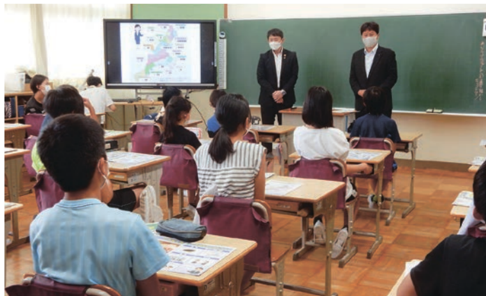
いなべ市立治田小学校