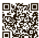
みえ県議会出前講座