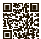
スマホ版 県議会だより