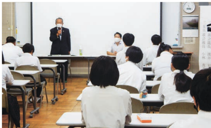
県立南伊勢高等学校(南勢校舎)