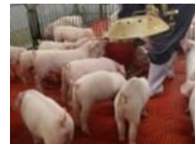
食品系残渣の飼料活用