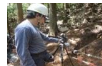
樹木根系の破壊抵抗力調査