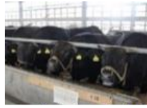
黒毛和牛未経産雌牛