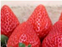
種子繁殖型イチゴ品種