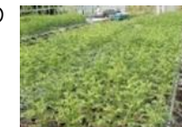
高品質なコンテナ苗