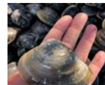
伊勢湾産ハマグリ