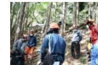
アカデミー講座への反映