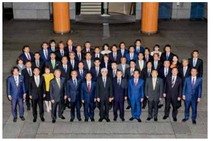
議事堂エントランスホールにて