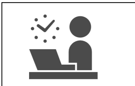
【スライド4：働く障がい者の方の様子①】