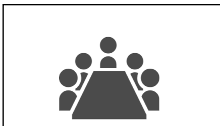
【スライド5：働く障がい者の方の様子②】