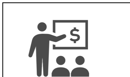
【スライド6：働く障がい者の方の様子③】