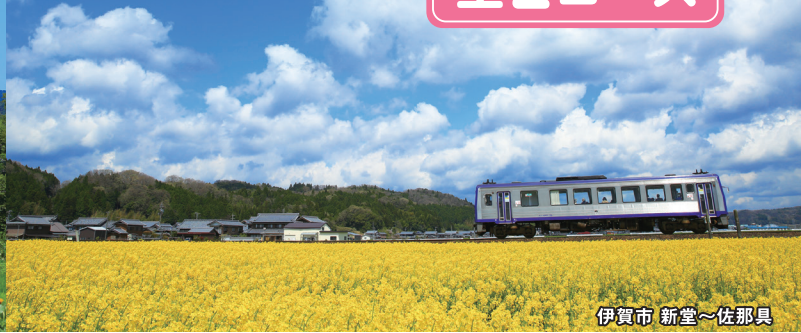
伊賀市 新堂～佐那具

新たにJR関西本線(亀山～島ヶ原間の全部又は一部の区間)を通勤利用し モニタリング調査にご協力いただける従業員(モニター)を対象に