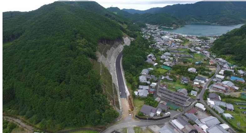
一般県道矢口浦上里線 道路改良事業 (紀北町)