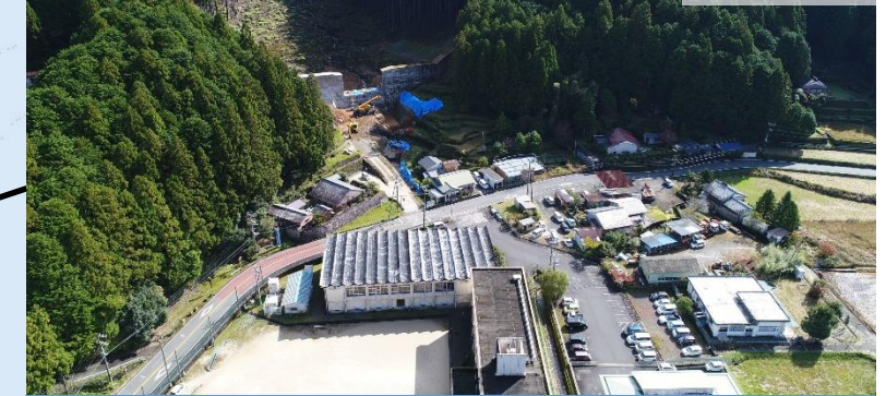
一級水系新宮川水系 うとだに 雨東谷 通常砂防事業 (熊野市)