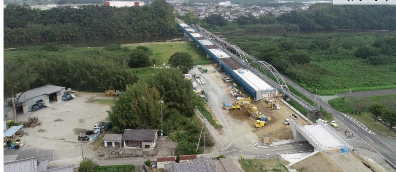
一般県道一志 てや 出家線 (中川原橋) 道路改良事業 (津市)

令和6年度末開通を令和6年内開通に前倒し 早期に東海環状自動車道へのアクセス性を確保!