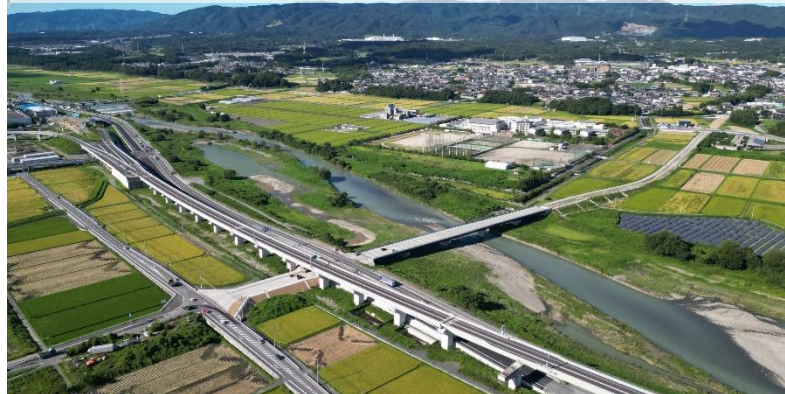
国道421号大安ICアクセス道路事業 (いなべ市)

令和6年度末開通を令和6年内開通に前倒し 早期に東海環状自動車道へのアクセス性を確保!