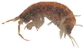
ニホンドロソコエビ