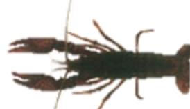
アメリカザリガニ

※ 目で見る事ができる大きさで、全国に広く分布している代表的な29種類を指標生物に選んで、水質判定の基準にしています。