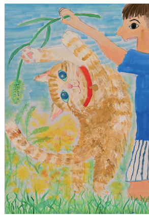
令和5年度動物愛護の絵・ポスター 小学校低学年の部 三重県獣医師会長賞

屋外では、交通事故やケンカ、病気をうつされるなど危険もいっぱいです。猫を大切に飼うとともに、ご近所への配慮を忘れないようにしましょう。