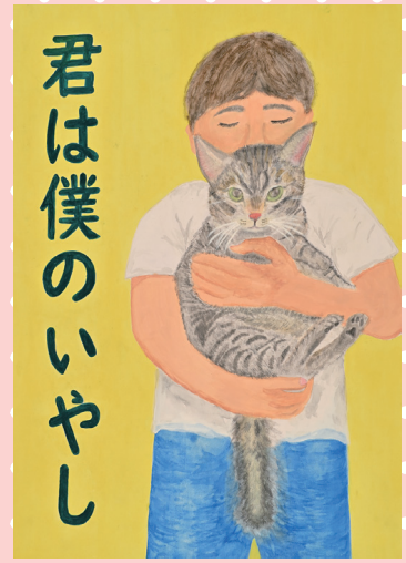
令和5年度動物愛護の絵・ポスター 小学校高学年の部 三重県知事賞