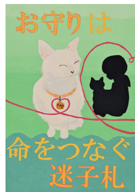
令和5年度動物愛護の絵・ポスター 中学校の部 三重県獣医師会長賞

万が一、飼い猫が逃げた時は、すぐに 保健所 と 警察 に連絡してください。 負傷している猫が運ばれても 、飼い主さんが誰か分からないことがとても多いです。猫の首輪に 迷子札 をつけておきましょう。また、首輪が外れても確実な身元証明になる マイクロチップ を入れて、 飼い主と確実に連絡がとれる住所、連絡先を登録 しておきましょう。