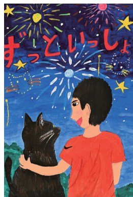
令和5年度動物愛護の絵・ポスター 小学校高学年の部 三重県愛玩動物協会賞