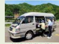
地域内移動を担う小型バス

交通不便地域における高齢者の移動ニーズなどをきめ細かく把握し、市町などが行う移動サービス導入を支援するほか、地域内交通ネットワークの構築に向けた取り組みを重点的に支援します。