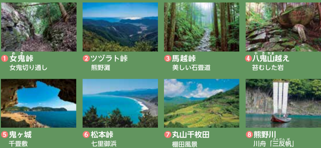
1 女鬼峠 女鬼切り通し 2 ツツラト峠 熊野灘 3 馬越峠 美しい石畳道 4 八鬼山越え 苔むした岩 5 鬼ヶ城 千畳敷 6 松本峠 七里御浜 7 丸山千枚田 棚田風景 8 熊野川 川舟「三反帆」

熊野古道とは… 古くより熊野三山（熊野本宮大社、熊野那智大社、熊野速玉大社）へ詣るために多くの人々が訪れた道で、いくつかのルートがあります。そのうち、県内を通る伊勢神宮から続く道は「熊野古道伊勢路」と呼ばれています。