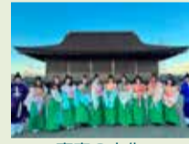
斎宮の文化体験コンテンツ

斎宮の認知度向上に向けた情報発信、誘客促進、史跡公園内の周遊構築、新たな文化体験コンテンツの造成などを行い、斎宮に賑わいを創出します。