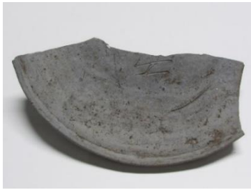
「安」刻書須恵器杯蓋

史跡齋宮跡東部にある方格街区の倉庫群である「寮庫」の区画から、「安」と線刻した須恵器が出土しています。このような「安」刻書須恵器は、伊賀国府跡や他の伊賀市内の遺跡からも出土しており、齋宮と伊賀との関連がうかがえる遺物です。この展示では、この須恵器からみる平安時代初めの齋宮を考えます。