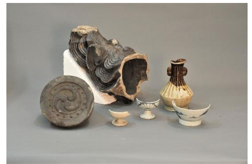
調査で見つかった甃や瓦、近世陶磁器類

令和5年度に、近世の参宮街道沿いで現在の竹神社前の交差点付近で発掘調査を行ったところ、『伊勢参宮名所図会』(寛政9(1797)年)などの史料に「大ほとけ」や「阿弥陀堂」と記された仏堂とみられる遺構や遺物が見つかりました。発掘成果と文献記録が合致する数少ない事例です。近世の参宮街道のすがたが偲ばれる展示です。