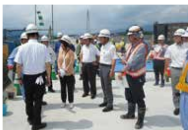
東海環状自動車道の工事現場にて

また、小学校高学年や中学生を対象とした防災教育をはじめ、避難所開設・運営マニュアルの作成支援や一般住民を対象とした防災キャンプなどの活動を継続して行っている玉城町防災ボランティアから、令和5年度「みえの防災大賞」を受賞した取り組みについて調査し、建設DXに積極的で、生産性の向上、効率化等による労働環境の改善にも取り組んでいる伊勢市の建設会社では、これからの建設業における働き方について調査しました。