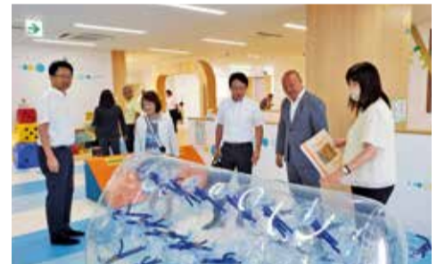
子育てに関する施策を調査

また、松阪市では、第3次松阪市健康づくり計画や認知症対策、妊娠・出産から子育て期まで切れ目のない支援に関する具体的な取り組みや成果・課題、「健康センターはるる」の施設内を調査し、伊勢市では、ひきこもりを含む孤独・孤立対策に関する具体的な取り組みや成果・課題、「伊勢市健康福祉ステーション」の施設内を調査しました。