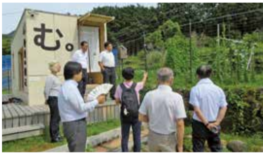
農園を拠点とした地域づくりについて調査

また、四日市市に本社がある三岐鉄道株式会社を訪れ、地域鉄道や路線バスが抱える課題や現状について説明を受けた後、地域公共交通の維持・確保に向けた意見交換を行いました。木曾岬町では木曾岬干拓地を訪れ、木曾岬町議会より説明を受けながら、未利用地の現状について調査しました。さらに、サッカーチームのホームスタジアムであるL A・P I T A東員スタジアムを訪れ、総合型地域スポーツクラブの取り組みなどについて調査しました。