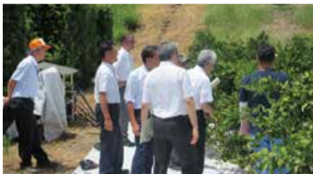
紀南果樹研究室の試験ほ場にて

熊野市では、令和11年度にオープン予定の「くまのほんわりファーム」の整備状況を調査し、御浜町では、農業研究所紀南果樹研究室において、かんきつ等果樹の試験研究状況を調査しました。さらに、多気町にある農園を訪れ「湿度で育てる」特許技術を活用した野菜の栽培方法について調査しました。