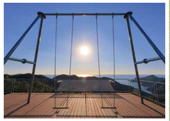
天空のブランコ たちばな展望台 (南伊勢町)