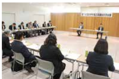
会議の様子 (いつきのみや地域交流センター)

会議では「三県の防災力向上に資する紀伊半島アンカールートの早期整備」および「半島地域における防災・減災、国土強靱化」の2つの議題について意見交換を行いました。この結果、「三県の防災力向上に資する紀伊半島アンカールートの早期整備」は整備の加速化等について、「半島地域における防災・減災、国土強靱化」は半島振興法の延長等について、それぞれ国に対し要望していくことが合意されました。