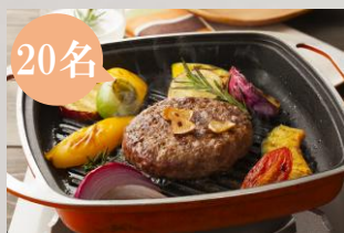
A みえジビエ 鹿肉ハンバーグ 150 g × 4個