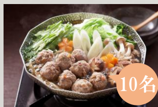
B みえジビエ 鹿肉のつみれ 160 g × 4個