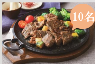
C みえジビエ 鹿肉の味噌漬け3種 (ロース/バラ/タタ) 140 g 各2個

本フェア参加店にて、買って、食べて スタンプカード をゲットしよう!! 1回のお買い物、ご注文ごと(金額問わ ない)にスタンプを1個贈呈します