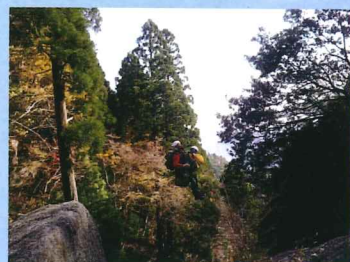
要救助者ピックアップ