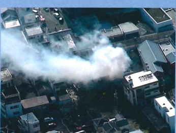
上空より火災の情報収集