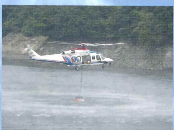
バケットに給水中