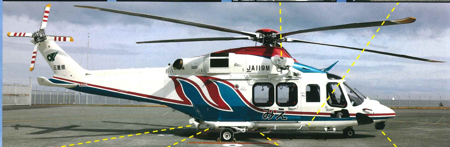
拡 声 器