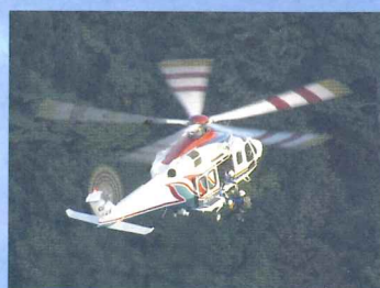
要救助者機内へ収容