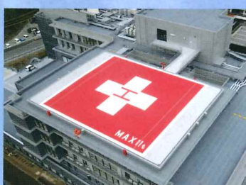
病院屋上ヘリポート