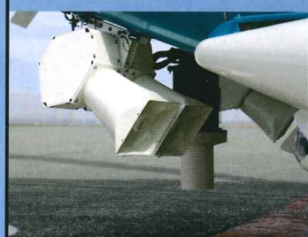
拡 声 器