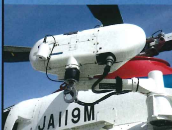
ホ イ ス ト 装 置