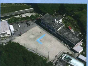
緊急サインの確認