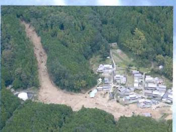
土砂災害等の状況把握

地震、台風、豪雨等の自然災害・大規模事故等の状況把握、各種災害等における住民への避難誘導及び警報の伝達及び被災地等への緊急物資・医薬品の輸送、医師等の輸送を行います。