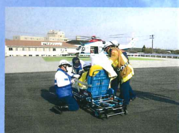
地上消防隊へ引継ぎ