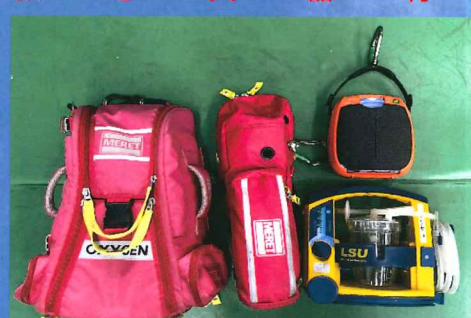
救 急 資 器 材