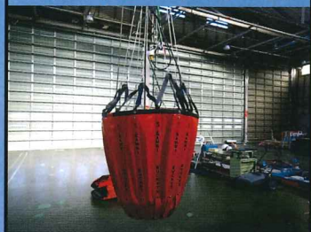
消火バケツト (最大水量 1,000ℓ)