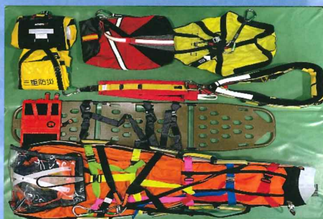
山 岳 救 助 資 器 材