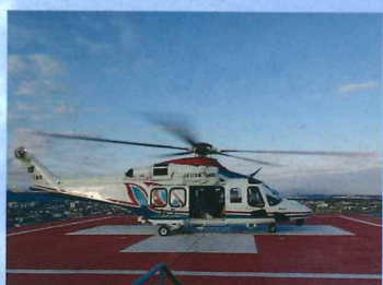
病院屋上ヘリポート着陸