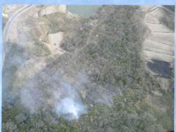
上空から火災現場確認