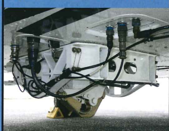
カ ー ゴ フ ッ ク