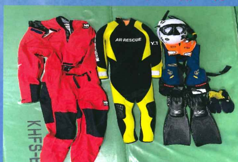
水 難 救 助 資 器 材