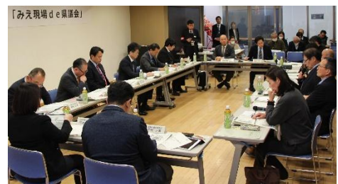
みえ現場 de 県議会の様子 (熊野市)