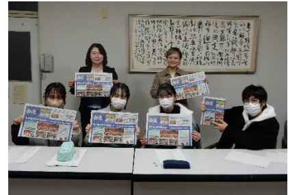
フィードバックの様子 (県立津高校)