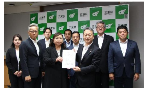
知事への申し入れ