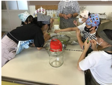
(ヘタ取り、ジュース作り)

地域の方々は梅シロップづくりの経験者も多くみえるので、ご指導いただきながら進めていきました。