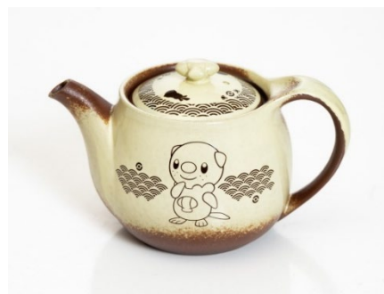
ミジュマルの万古焼急須ポット