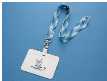
伊賀くみひもネックストラップ ミジュマルVer.