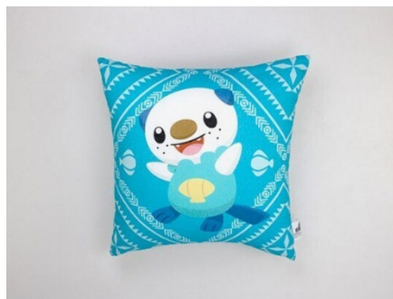
ミジュマル イセノモンクッション