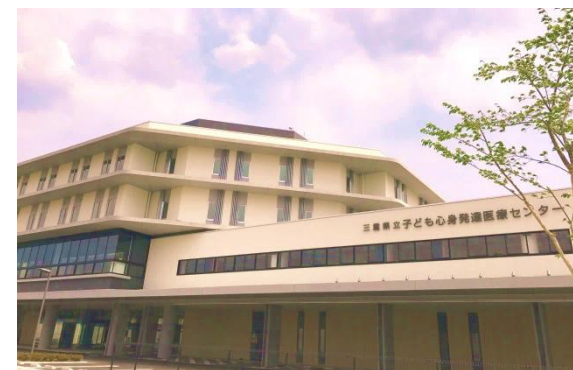
三重県立子ども心身発達医療センター