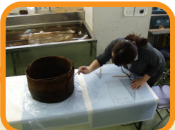
出土品の形や模様を図面や写真に記録し、調査成果を報告書にまとめます。