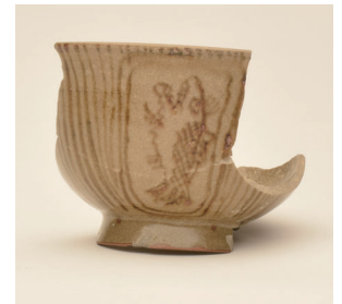
古萬古窯跡 鮎文茶碗陶片 (朝日町歴史博物館蔵)