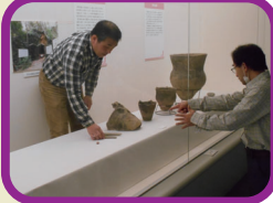
展示や出前講座といった公開普及活動を通じて、調査・研究成果や考古学の魅力を発信しています。