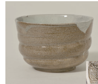
津城跡 安東焼ろくろ碗 (三重県埋蔵文化財センター保管)

今回の展示は、技術の系譜に着目し、三重県内の遺跡から出土した萬古焼や安東焼、阿漕焼などの遺物を紹介します。