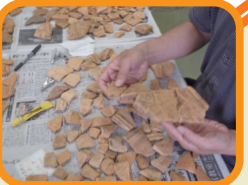
乾いた破片を、接着剤で接合します。欠けている部分はせつこうで埋めて復元します。