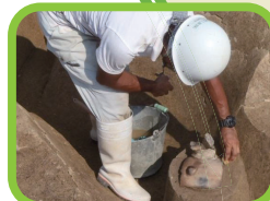
土器や石器を取り上げます。