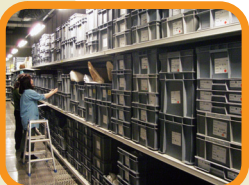
土器や石器、写真や図面は、管理番号をつけて収蔵します。

てんらんかい 展示会では、けんないかくち 県内各地からしゅつど しりょう 出土した資料の展示をおこなっています。