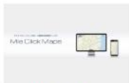
Mie Click Maps