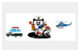
Mie Click Maps for 三重県 警察ページ