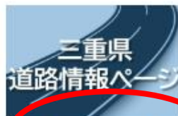
Mie Click Maps for 三重県 道路情報ページ