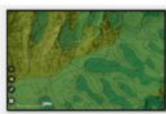
Mie Click Maps for 三重県 森林ページ