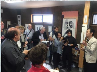
第3回プレスツアー(H28.5.12) (於: 鈴鹿市)