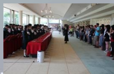
セントヨゼフ女子学園 によるハンドベル演奏

また、分散型体験・交流行事での各地案内、おもてなし及び交流や、討議・宿泊会場におけるサポートデスク設置などにおいて、県民の皆様や企業、団体の皆様にご協力いただきました。