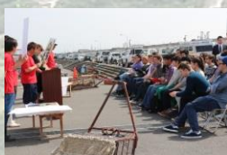
赤須賀漁業協同組合

4月23日(土)、討議テーマに基づき、環境保全と経済成長を両立し、健全な環境を次世代に継承し、持続可能な発展をする方策について議論するため、赤須賀漁業協同組合、四日市公害と環境未来館、NTN株式会社先端技術研究所を視察しました。