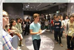
四日市公害と環境未来館