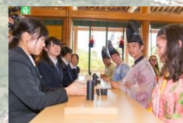
いつきのみや歴史体験館