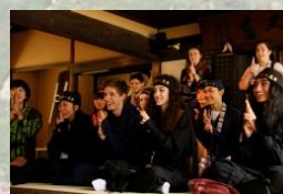
伊賀流忍者博物館