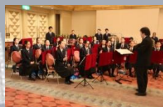
白子高校吹奏楽部による 演奏