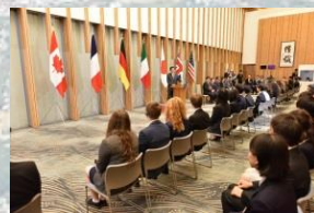
参加者による総理表敬