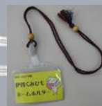
特別支援学校の生徒が 作ったネームホルダー