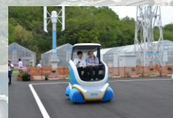
NTN(株)先端技術研究所