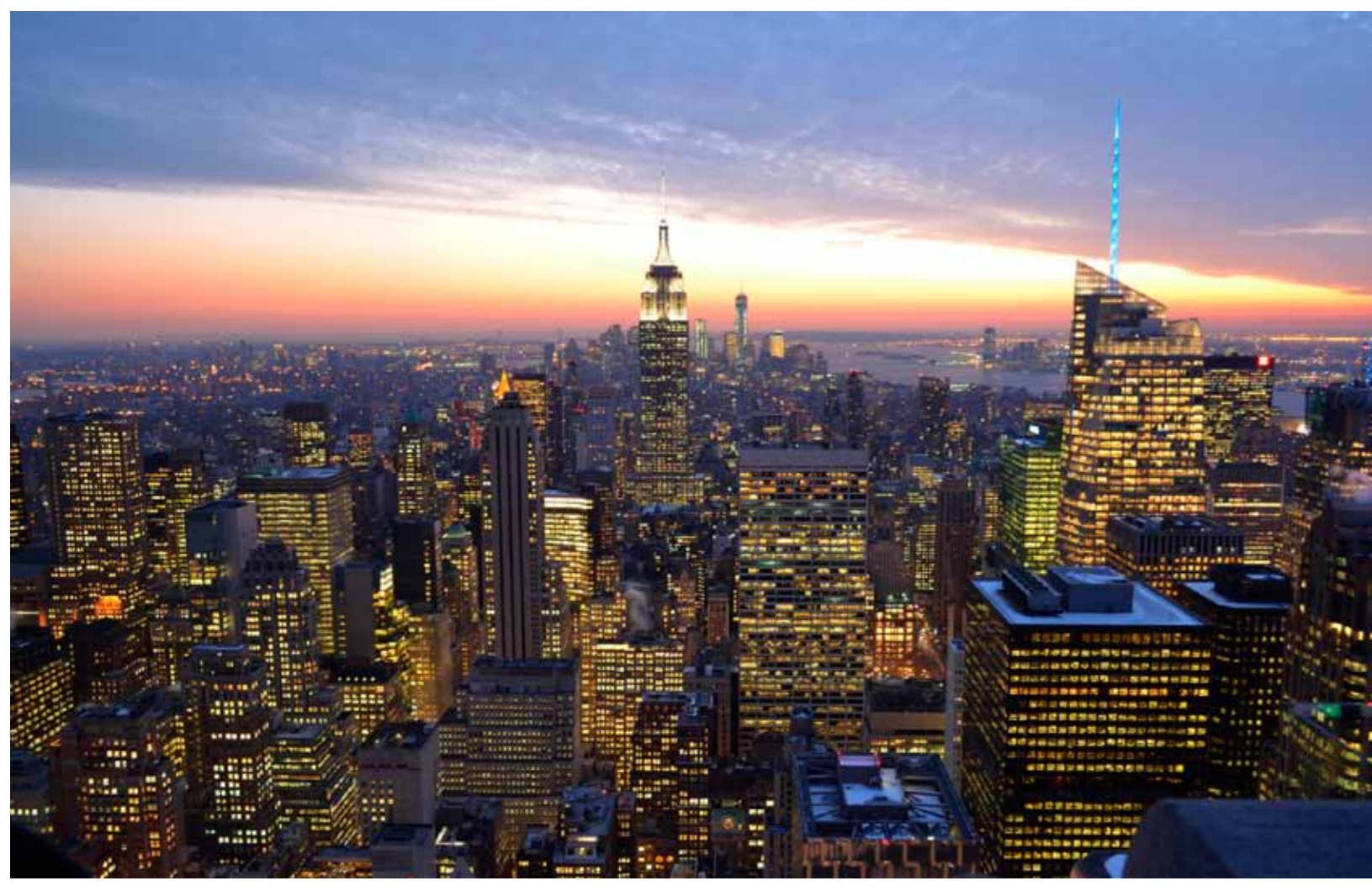
ニューヨークの街並み