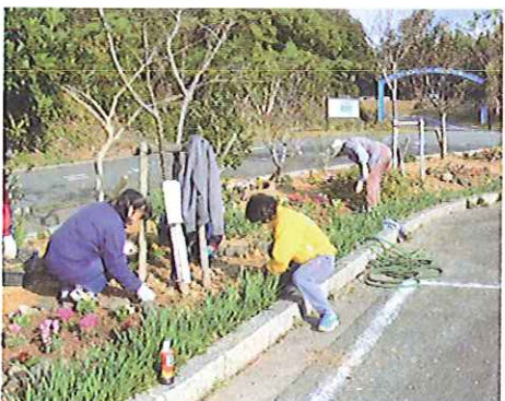
H23 緑の募金交付事業 志摩いそぶえ会