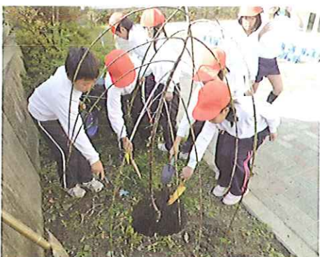
H23 緑の募金交付事業 津市立川合小学校