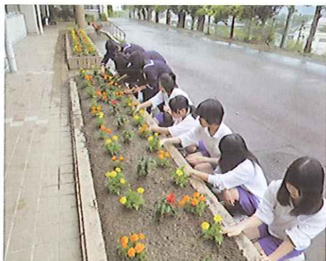
H24 春期緑化運動 大台町立大台中学校