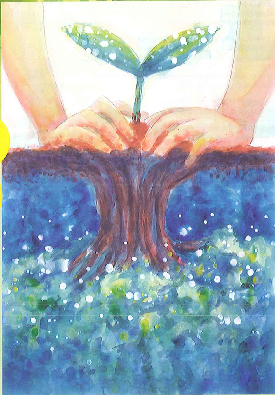
平成25年用国土緑化運動・育樹運動ポスター原画コンクール三重県知事賞受賞作品 絵 三重県立いなべ総合学園高等学校3年 小林 実央さん

森林はCO 2 の吸収源としての地球温暖化防止や災害の防止、水源のかん養などに大きな役割を果たしています。しかし今、世界の森林は減少し、わが国の森林は手入れ不足により荒れています。人間が必要な手助けをして、豊かな森林を守り育てることが、地球温暖化防止など様々な機能を発揮し、未来へとつなげていくこととなります。