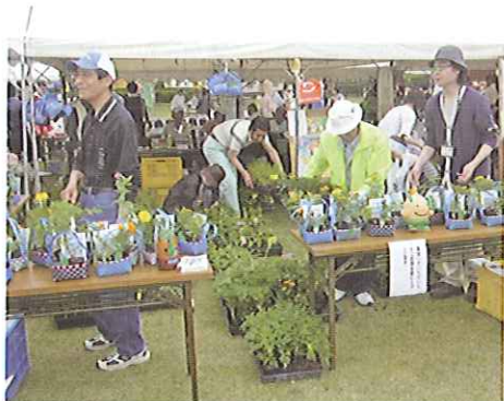
H24 春期緑化運動 明和町 緑のまちづくり推進委員会

※その他は、繰越金で翌年度に緑の募金が入金されるまでの期間、春期緑化運動経費等に使用します。