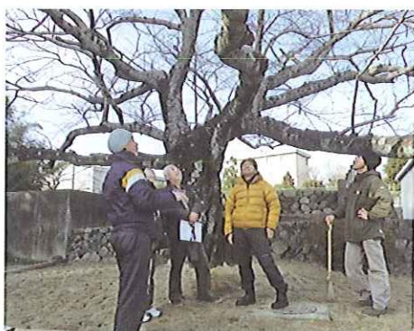
H23 樹木健康診断 四日市市小山田地区市民センター ソメイヨシノ