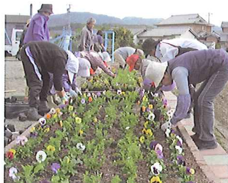
H23 緑の募金交付事業 伊勢市粟野区