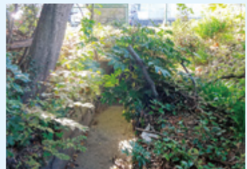
ろっぱのいすい 六把野井水の ようす

いま から 400年 くらい 前に、みず 水ぶそくを なくす ために つくられました。