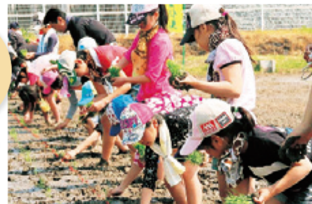
のうぎょうたいけんの 田うえの ようす