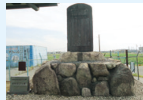
かん だ ようすいの せき 石ひ (不忘ひ)

かん だ ようすいの 神田用水が かんせいして、みず 水ぶそくに くるしんだ、とういんちょうの 東員町の ひと 人びとの ねがいが かないま した。