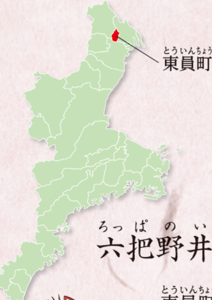
とういんちよう 東員町