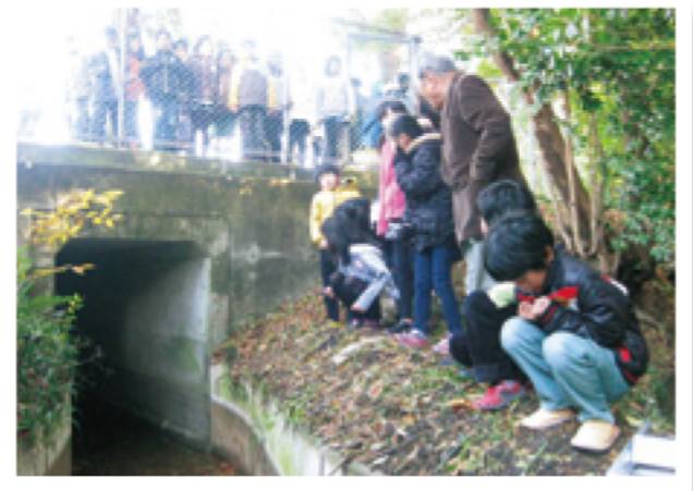
がっこうの したを ながれる 六把野井水の ようす

その後も 工事が 行われ、今では 広い 土地に 水が いきわたるようになりまし。おもに、米などの 作もつを そだてるために つかっています。