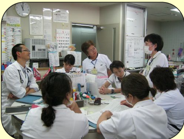
● 病棟カンファレンスのようす ●

病棟では、毎日、その日の担当看護師と病棟担当医師が全員集まって、患者さんの状態を報告したり、看護方針を決定する病棟カンファレンスを行っています。