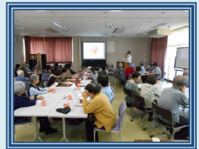
健康教室（5月）のようす