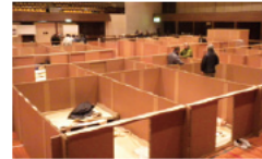
尾鷲市での訓練の様子

県は、本年1月に市町や自主防災組織などを対象にした「避難所運営マニュアル策定指針」を改定しており、2月には尾鷲市でこのマニュアルを活用した防災訓練が行われています。