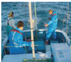
若者を研修する漁協の「漁師塾」の様子

答 これまでの施策の着実な推進に加え、市町や関係団体などと連携を図りながら、漁業の担い手対策のための協議会設置による多様な担い手の確保・育成、水産物の計画生産の体制整備、輸出に対応した水産物流通の検討などの新しい取り組みを展開し、「もうかる水産業」の実現につなげていきます。