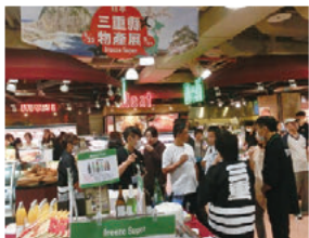
「三重県物産展in台湾」の様子

答 本県には、①三重ブランドに認定した食材など魅力的なものが多くあり、こうした強みを海外展開するため、「みえ国際展開に関する基本方針」を策定し、輸出拡大に取り組むこととしています。今後、関係団体などによる輸出支援組織を立ち上げ、オール三重県で農林水産物の輸出拡大につなげていきます。