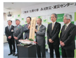
みえ防災・減災センターの開所式

南海トラフ地震対策や局地的大雨などの風水害対策「みえ防災・減災センター」による防災人材の育成など、災害に強い三重づくりに向けた取り組みなどについて調査します。