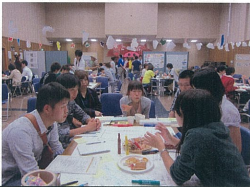
チーム三重で、今後の活動に生かせることを議論

ワークショップでの議論を受け、団体毎に、アイデアをどう取り入れて、自分たちの活動に生かしていくかを議論したうえで、それぞれのまとめたものを発表しました。