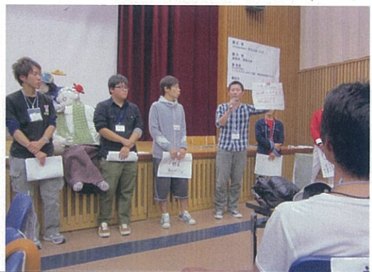
各団体の「これからやります宣言」として発表