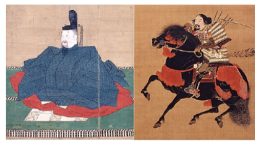
後醍醐天皇画像 嵐山寺蔵 騎馬武者像 京都国立博物館蔵