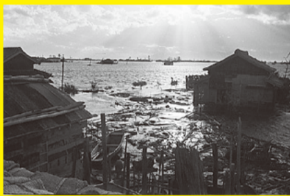
旧水戸村