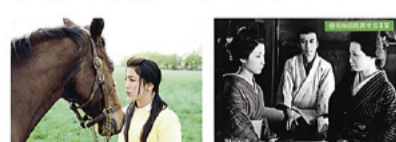
「三本木農業高校 馬術部～盲目の馬と少女の実話～」 「華岡青洲の妻」