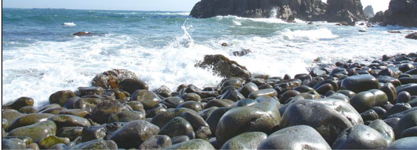
岩手県久慈市 つりがね洞