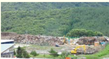
久慈市内の仮置き場