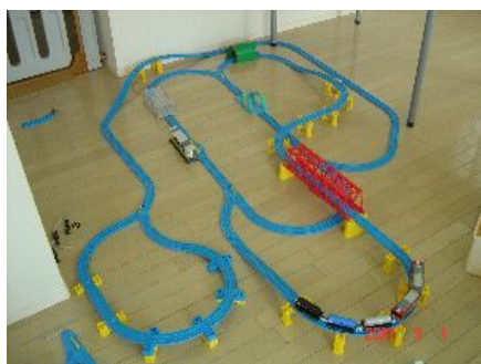
お兄ちゃんと作ったプラレールのレイアウト

そう、これは男の世界なのです。女性には理解できない男の世界が存在するのです(ペンネームは少女ですが、筆者は男性です)。