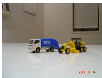
左: 次男お気に入りのゴミ収集車 右: お兄ちゃんお気に入りのモーターグレーダー

私は松阪食肉衛生検査所理化学班に所属しています。理化学班はその名のとおり理化学検査をしますが、理化学検査とは主に食肉の残留抗菌性物質の有無について検査します。